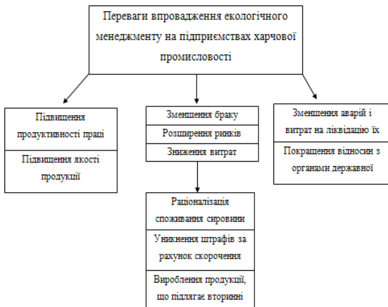
Рисунок 1 - Переваги впровадження екологічного менеджменту на підприємствах харчової промисловості

Загальна тенденція до зниження фактичного впливу на навколишнє природне середовище також здійснюється за умови ефективної діяльності підприємств харчової промисловості в галузі екологічного менеджменту. На рисунку 1 зображені переваги впровадження екологічного менеджменту на підприємствах харчової промисловості.